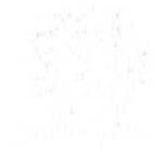
Figura 1: mapa do estado de Pernambuco..... 8